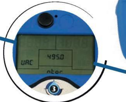
Integrated electronic vacuum gauge Integriertes elektronisches Vakuummeter