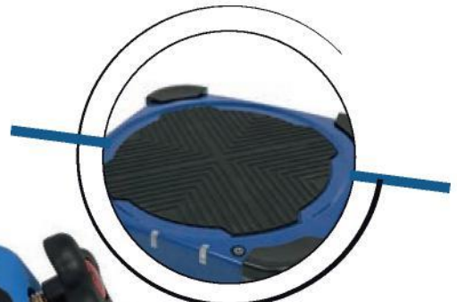
Wireless Scale Drahtlose elektronische Waage