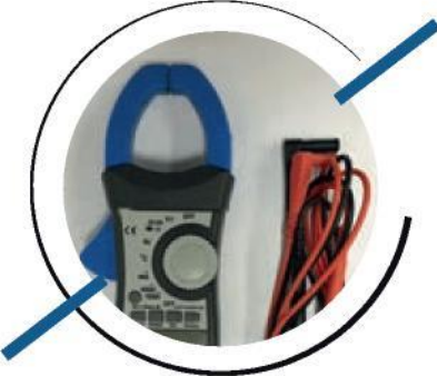
Wireless clamp meter Drahtloses Digitales Zangen-Ampere-meter